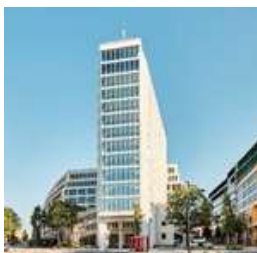
Springer Quartier Hamburg