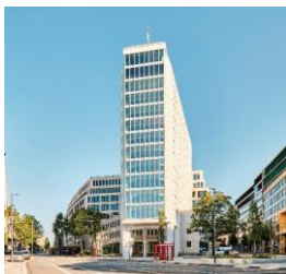
Springer Quartier Hamburg