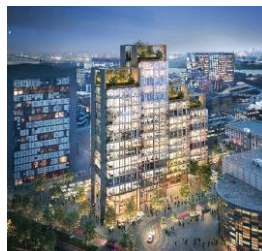
UNIQ Towers Düsseldorf