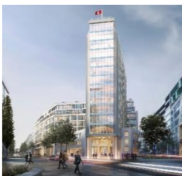
SPRINGER QUARTIER Hamburg